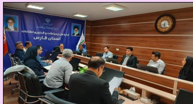
نشست کمیته استانی نظارت تعهدات دارنده پروانه و اعمال مقررات