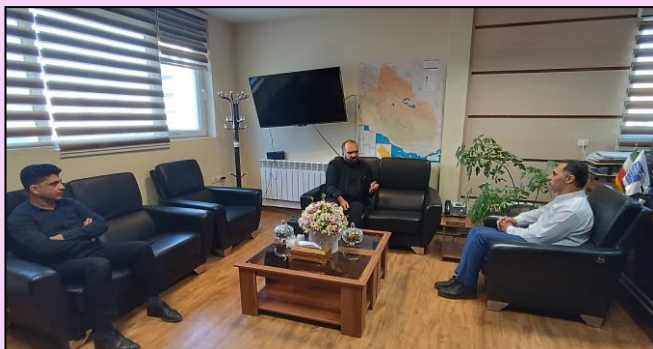
ملاقات و تکریم ارباب رجوع