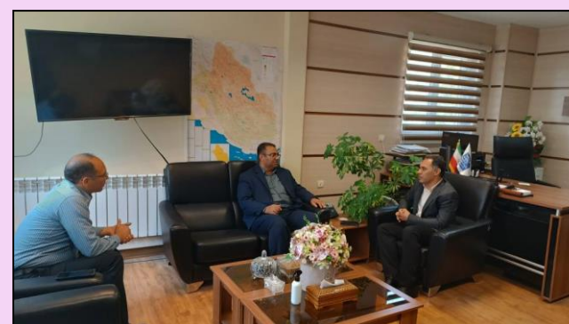
دیدار با بخشدار مرکزی لار در خصوص رفع مشکلات ارتباطی