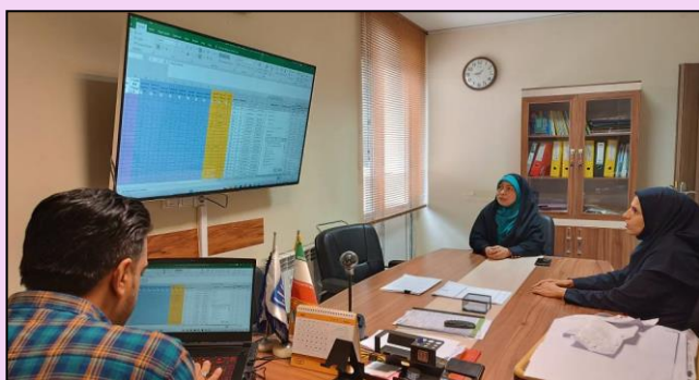
دیدار با بخشدار مرکزی اوز جهت رفع مشکلات ارتباطی