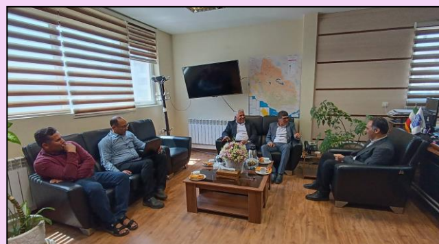
دیدار با رئیس مخابرات و بخشدار مرکزی زرکان در خصوص رمشکلات ارتباطی روستاها در این بخش