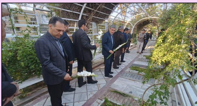
مراسم گلاباران قبور مطهر شهدا در گلزار شهدا دالرحمه شیراز به منظور گرامیداشت هفته دولت در معیت استاندار فارس