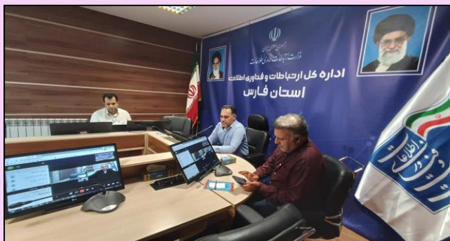
جلسه ویدئوکنفرانسی شورای راهبری مدیران بخش ارتباطات و استان فارس