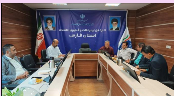
جلسه هماهنگی برگزاری دوره آموزشی مدیریت اقامه نماز با حضور دبیران اقامه نماز واحدهای تابعه وزارت در استان فارس